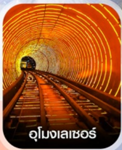
อุโมงเลเซอร์

✈️ คอนเฟิร์มออกเดินทาง ✈️ ทุกพีเรียด 2 ท่านขึ้นไป