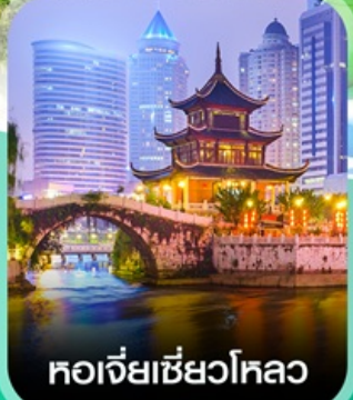
หอเจี่ยเซียงโหลว