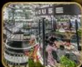
อาคาร เริ่มต้น WAREHOUSE NO.3