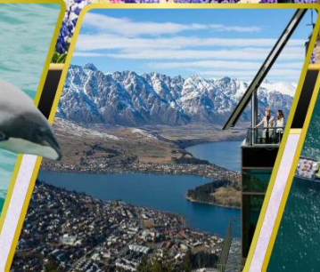
ยอดเขานีออนส์พีค