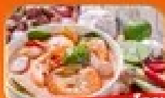
พิเศษ อาหารไทย

1-6 พ.ค. / 30 พ.ค. - 4 มิ.ย. 69 25 - 30 มิ.ย. 69