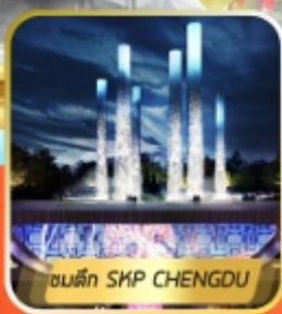
สวนตึก SKP CHENGDU