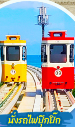
นั่งรถไฟปู๊กบีก

ราคานี้รวมค่าภาษีน้ำมัน + ค่าภาษีสนามบิน ** ปรับขึ้น ณ วันที่ 1 เม.ย. 69 เรียบร้อยแล้ว **