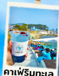
คาเฟ่ริมทะเล