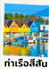
ท่าเรือสีสัน