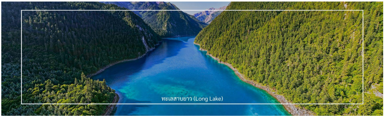
ทะเลสาบยาว (Long Lake)