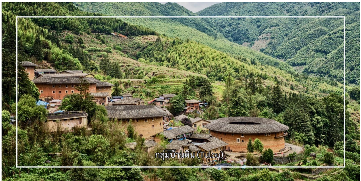
กลุ่มบ้านดิน (Tulou)

เที่ยง รับประทานอาหารเที่ยง ณ ภัตตาคาร (มื้อที่ 3)