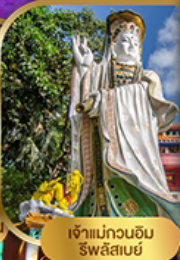
เจ้าแม่กวนอิม รวิไลสมย์