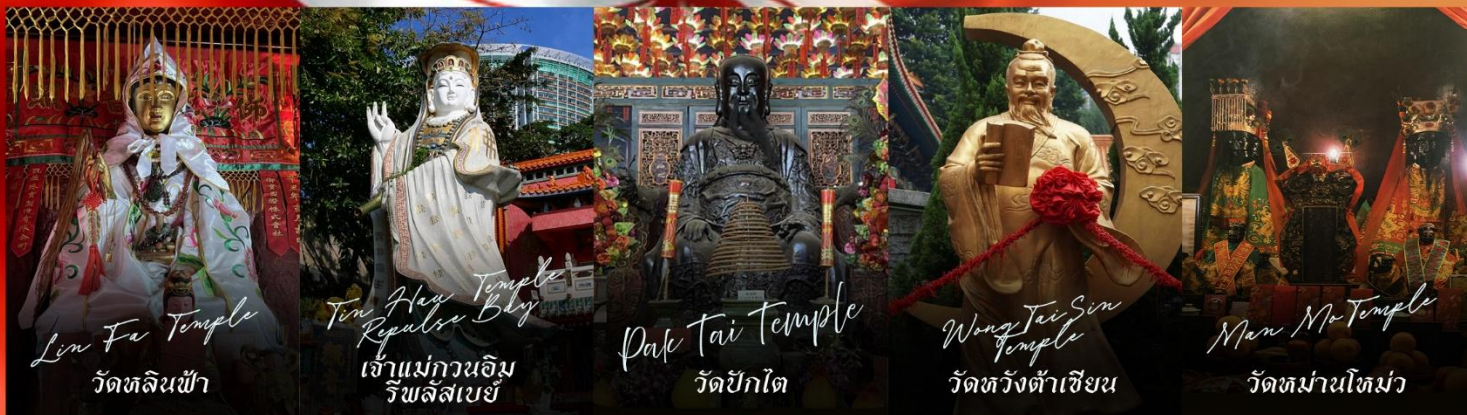
Lin Fu Temple วัดหลินฟ้า

รายการทัวร์ข้างต้นอาจมีการปรับเปลี่ยนเพื่อความเหมาะสม