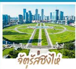
จัตุรัสชิงไฉ่