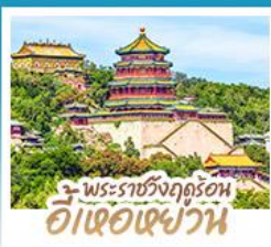
พระราชวังฤดูร้อน อี่เซว่เฉว่วาน

ทริปเดียวเที่ยว 2 เมือง ปักกิ่ง-ต้าเหลียน • เที่ยวจีนฟัลยูโรป ณ เมืองวนิสแห่งต้าเหลียน • สัมผัสประสบการณ์ขึ้นกำแพงเมืองจีน ด่านจวิยกวน • ซ้อป ซิม ซิล ที่ถนนโบราณคกงวนและย่านชานหลี่ถุน