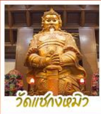
วัดเขกงเมิว