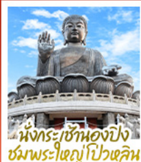
นั่งกระเช้ามองปิง ชมพระใหญ่ไผ่หลิน

นั่งกระเช้ามองปิงสักการะพระใหญ่ไผ่หลิน • วัดหวังต้าเซียน ขอพรสุขภาพ ความรัก วัดเข่งหมิว ขอพรองค์เซกุง โชคลาภ การเงินและธุรกิจ • เจ้าแม่กวนอิมรัฟัสส์เบย์ รับพลังงานดี เสริมพลังชองจู้ • วัดหมิ่นโหมว ขอพรเรื่องการศึกษ การงาน สติปัญญาและความกล้าหาญ