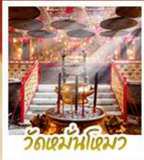
วัดเมฆน้ำเฒว