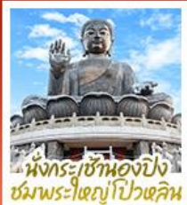
นั่งกระเช้ามองปิง ชมพระใหญ่ไป๋หลิม

นั่งกระเช้ามองปิงสีกการะพระใหญ่ไป๋หลิม • วัดหวังต้าเซียน ขอพรสุขภาพ ความรัก วัดเขกหนิว ขอพรองค์เขกง โชคลาภ การเงินและธุรกิจ • เจ้าแม่กวนอิมรพีลาลัย ธิพพลังานติ เสริมพลังชองจ้อย • วัดมื่นไทมว ขอพรเรื่องการศึกษา การงาน สติปัญญาและความกล้าหาญ