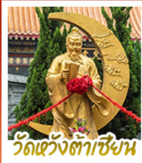
วัดเว้งต้าเซียน