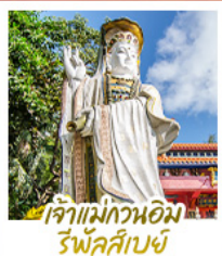
เจ้าแม่กวนอิม รัฟัสส์เบย์