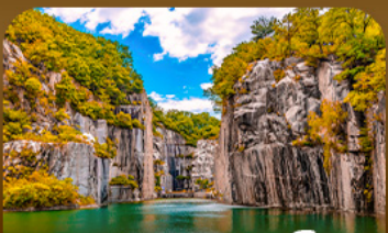
เขื่อนเขาดิกปะเมืองโพซอน

ตามหาใบไม้เปลี่ยนสีสุดโรแมนติก ชมวิวเมเปิ้ลหลากสีจากสะพานแวงรูปตัว Y แห่งเมืองโพซอน สัมผัสความงดงามของโพซอนอาร์ทวอล์ก • เดินเล่นท่ามกลางต้นแปะทิวและเมเปิ้ลในพระราชวังเคียงบกกรุง ชมหมู่บ้านอันอกกลางบรรยากาศย้อนยุค และปิดท้ายด้วยทุ่งหญ้าสีทอง ณ สวนฮานิล แลนด์มาร์กยอดนิมของกรุงโซล ในช่วงฤดูใบไม้เปลี่ยนสีที่สวยงามที่สุด