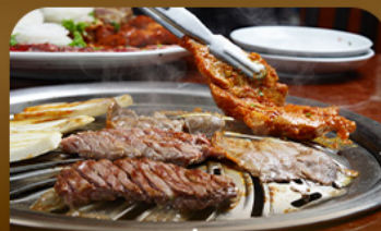
เมนูข้างสัปดาห์เกาหลี