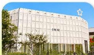
บรูกลินเกาหลี