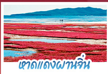
เขาดแดงผานจีน