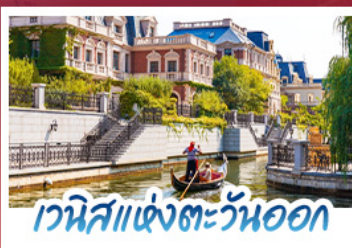
เวนิสแห่งตะวันออก