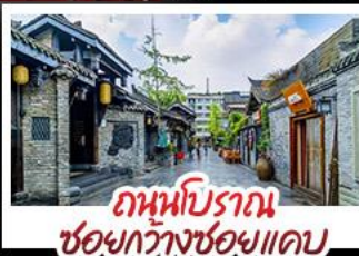
ถนนโบราณ ชอยกว้างชอยแคบ