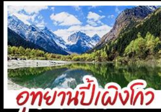
อุทยานป่าผิงโกว