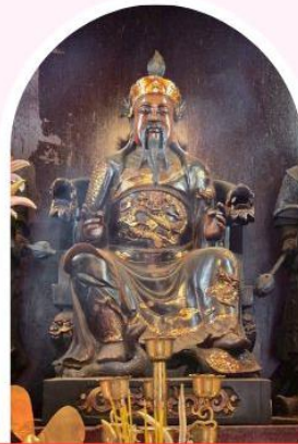
วัดปักโต เสริมโชคลาก นำพาความรุ่งเรือง