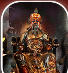
วัดปิกโต