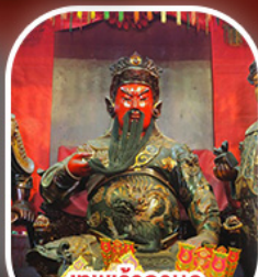
เทพเจ้ากวนอู วัดกวนโก