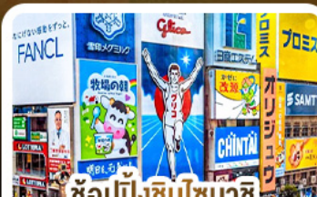
ซ ้อ ป ั น ัง ซ ิ น ซ ิ บ าย ะ ช ิ แ ล ะ โ ด ต ง โ ม ะ ริ