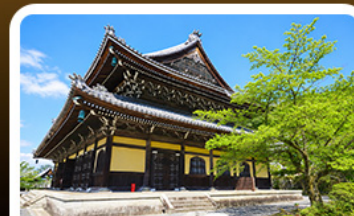
วั ด น ัน เ ช ิน จ ิ