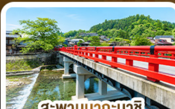
สะ พ าน น าก ะ บ าย ะ ช ิ ท าก าย ะ ม ่า