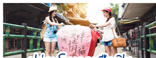
ปลั๊กอินมัลติคอมมูนิคชั่น