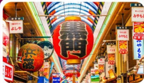
ตลาดปลาคุโรมง