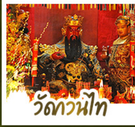
วัดกวนน้้ท