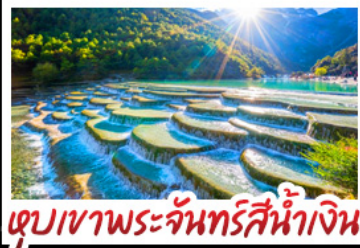
เขาวงพระจันทร์สีน้ำเงิน

ภูเขาหิมะมังกรหยก - เมืองโบราณเซงกรีล่า วัดลามะชงจ้านหลิน - รถไฟขบวนวิภูเขาหิมะมังกรหยก สวนดอกไม้ฮวงวี่มู่ฉ่าง - เมืองโบราณลี่เจียง ภูเขาพระจันทร์สีน้ำเงิน - เบนูพิเศษ สุกี้ปลาเซลมอน