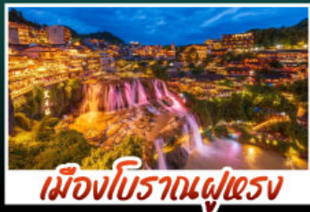
เมืองโบราณฝูเฉิง