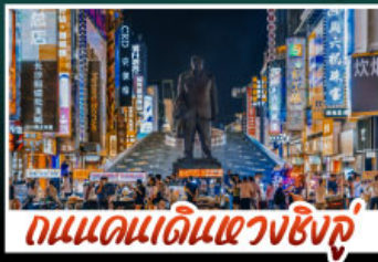
ถนนแดนแดนเซี่ยงชู่