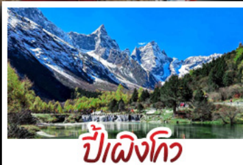
ป่าผิงโกว