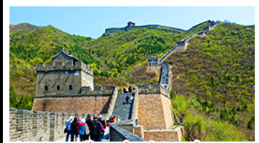
กำแพงเมืองจีนด่านจวิยงกวน