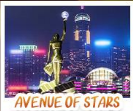
AVENUE OF STARS