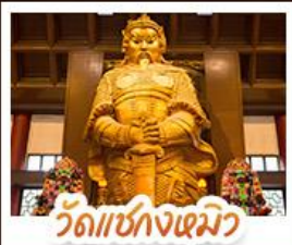
วัดเซ่งโงเมียว