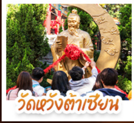
วัดเข่งต้าเซียน