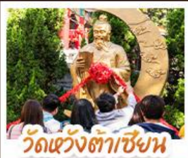
วัดเซ่งโงเมียว