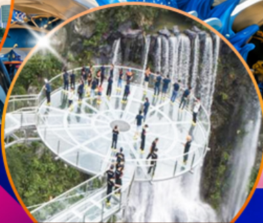
สะพานแก้วคู่หลงเซี่ยะ