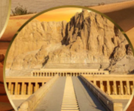
หุบเขากษัตริย์