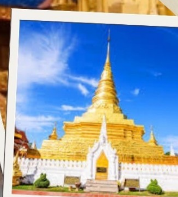
วัดพระธาตุแช่แห้ง