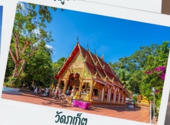
วัดภูเก็ต