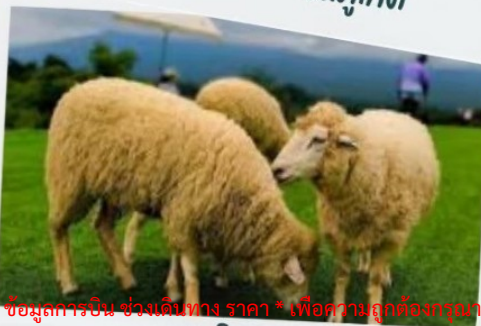
ฟาร์มแกะ