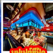
บุฟเฟต์ซีฟู้ด