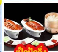
เปิดปิกนิก