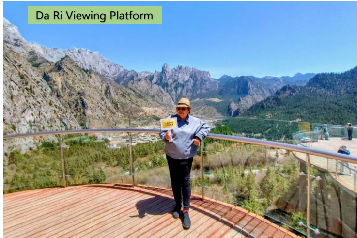
Da Ri Viewing Platform