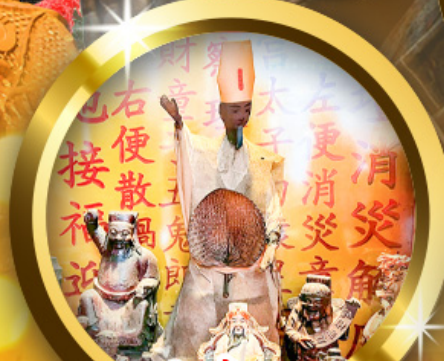
เทพเจ้าเสื่อกระสอบ พิธีลูบพัดโบราณ