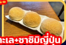
บุฟเฟ่ต์ชาบูพรีเมียม สุกี้อาหารทะเล+ชาฮิมิญี่ปุ่น เต็มชำระดับมิชลินสตาร์