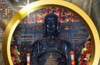
เทพเจ้าปิกโต ชัยชนะในชีวิต