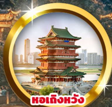
หอเทียนหวัง