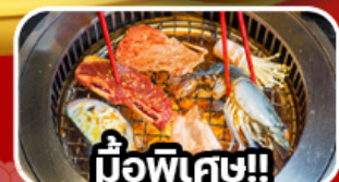
มือพิเศษ!!