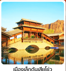
เมืองเล็กตันเสี่ยวโซ่ว