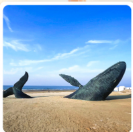
วาฬผู้โดดเดี่ยว