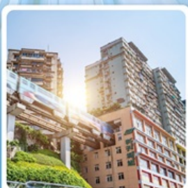
รถไฟฟ้าชุดัก

ไฮไลท์! เทียวอุทยานแห่งชาติหลุมบ่อฟ้า มรดกโลกระดับ 5A ชมรถไฟฟ้ากะลุดัก อลังการแสงสีที่หงหยาดัง