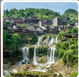
ฝูรงเจิน