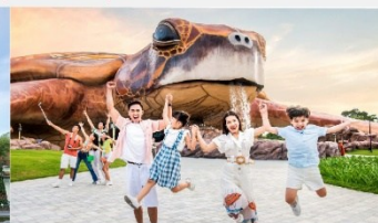
วินเพิร์ล อควาเรียม

*ทางบริษัทฯ ขอสงวนสิทธิ์ในการสลับโปรแกรมทัวร์ตามความเหมาะสมขึ้นอยู่กับสถานการณ์หน้างาน โดยคำนึงถึงผลประโยชน์ของลูกค้าเป็นสำคัญ