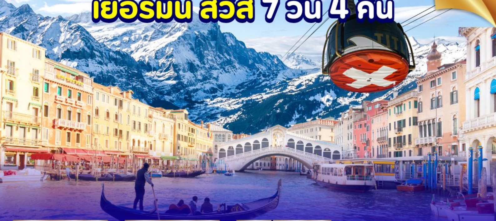
ยอดเขาทิตลิส