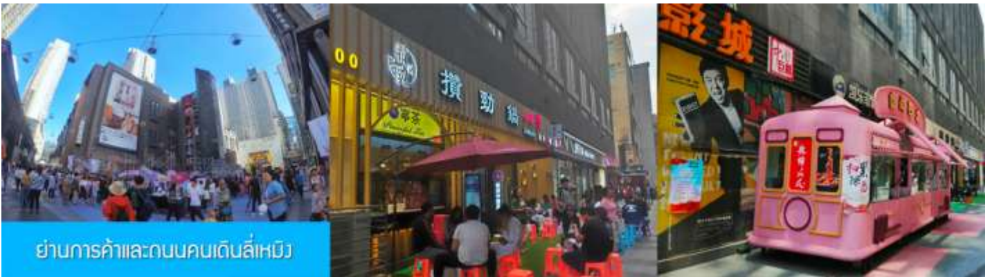
ย่านการค้าและถนนคนเดินลีเหมิง

เที่ยง รับประทานอาหารกลางวัน ณ ภัตตาคาร (18)