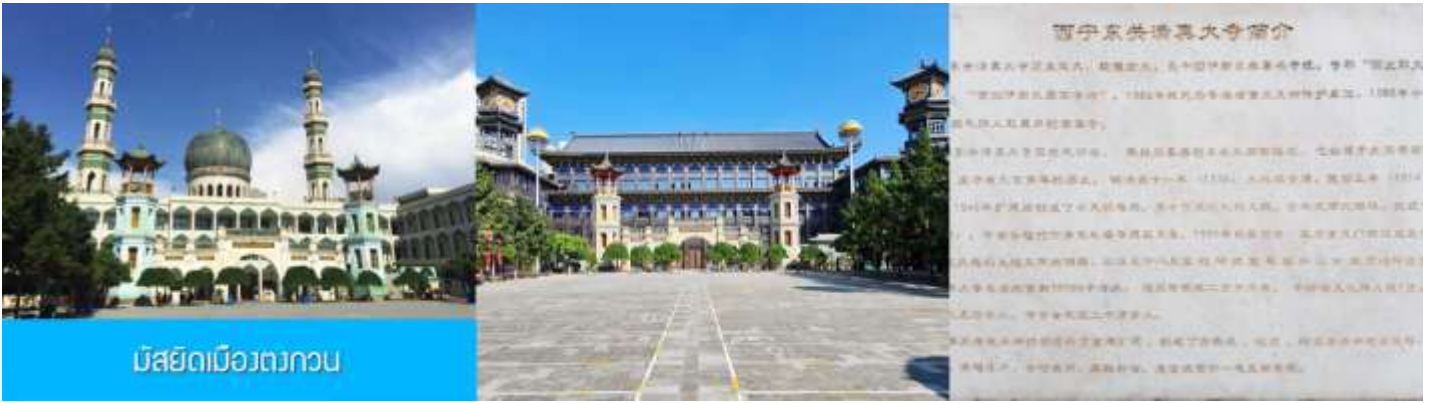
มัสยิดเมืองตงกวน