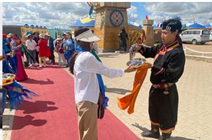
พิธีต้อนรับแขกด้วยเหล้า