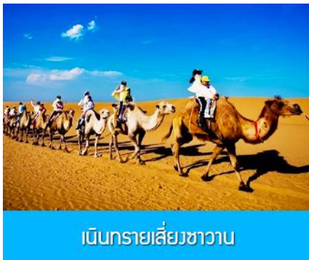
เนินทรายเสียงชาวาน