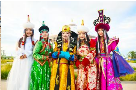
แต่งชุดพื้นเมืองมองโกล