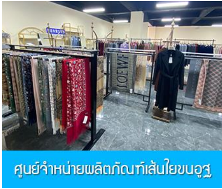
ศูนย์จำหน่ายผลิตภัณฑ์เส้นใยขนอูฐ