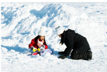
Playing in the snow