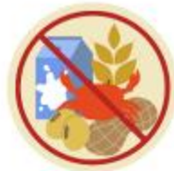
แพ้อาหาร / อื่นๆโปรดระบุ