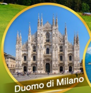
Duomo di Milano