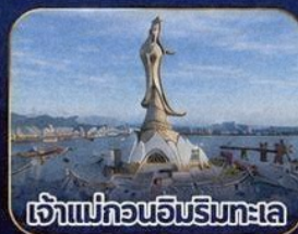
เจ้าแม่ทวนอิมริมทะเล