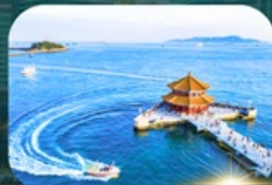
สะพานฉานเจียว