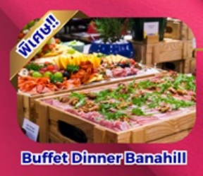
Buffet Dinner Banahill